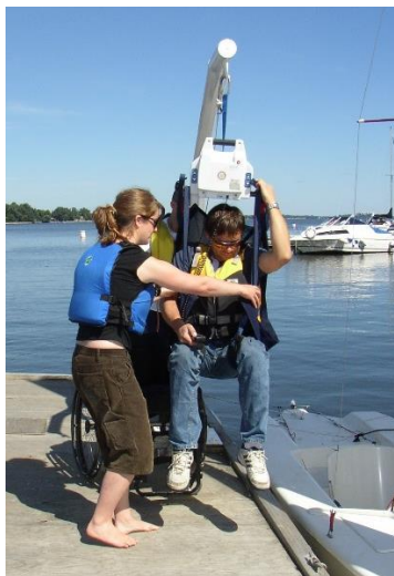
TRANSFERT AVEC LÈVE-PERSONNE